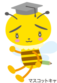
マスコットキャラクター はっちゃん丸